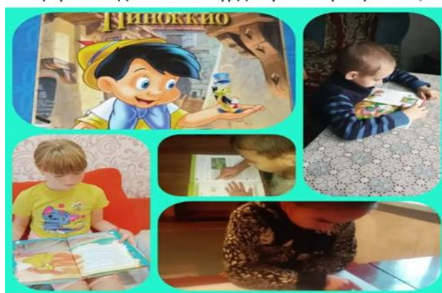
Гүлжанат Айтқужина и ещё 2

https://www.facebook.com/osnavnaa.skola.5/posts/pfbid0PHyVi4zCGNmnsQaKbHeqtuk6Yq3mKXCbKhjLCrMc7akbvKYVfvcCoPN5oV8X3Mvl